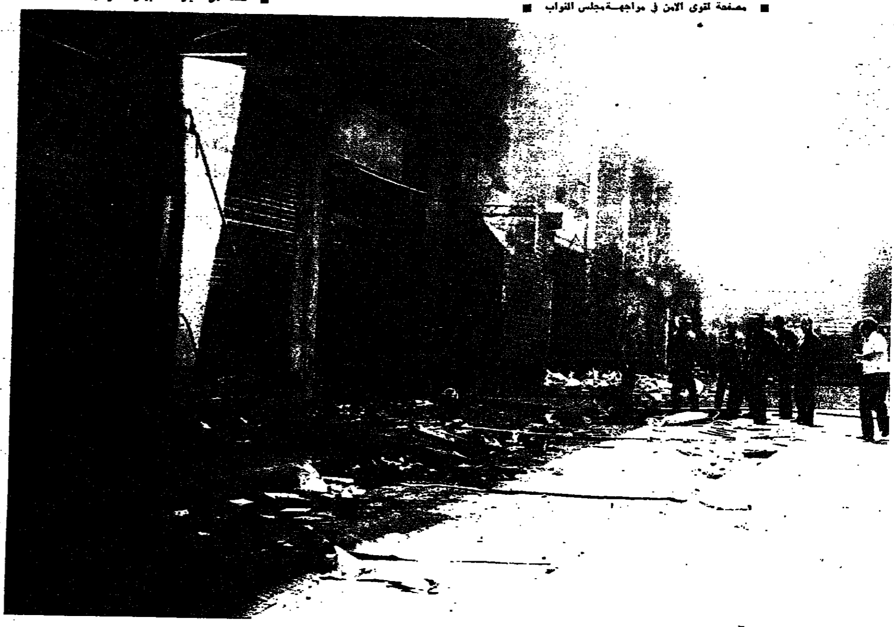
■ رجال الاطفا يحاولون القضاء على بقايا الحريق في بداية المازارية.

الانفراج الذي نأمل المواطنين بخصوله امس ، ووقعوا ان يتسع اليوم ، عكره مرة اخرى رصاص القناصين الذين حولوا مواصلة نشاطهم امس ، ولو على نطاق محدود رغم تصدي قوى الان لجم . وقد ظهرت بوادر زوال الظاهر المسلحة في معظم احياء العاصمة ، فيما بدأت دوريات من قوى الان صاعدة بالمسحات تجريب المناطق التي كانت مسرحا للاحتجاجات من قبل . ومنذ الظهور شوهدت الكيانات وشاحنات تابعة للجيش ، محملة بالجنود وهي تجوب شوارع بيروت بعد ان تبت اعارة التي سيطر عليها وجندي الى قوى الان لمساعدتها على السيطرة على الارض . وفي نفس الوقت كان اصحاب المحلات التي احتوت او حوت يحاولون انتقاها بما يمكن انتقاله من بين القناصين ، ولكن عبثا .